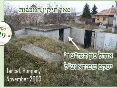
תשע"ה פאראכטן די מצבות בעהש"י האפט מען אויפצושטעלן מיט פעסטע יסודות